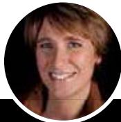
MARIAN EN MIRANDA

No. 28 wonen & lifestyle | Nieuwstraat 28 Dordrecht | 078 8431491 Statenplein 27 Dordrecht | 078 7853445 | info@no28.nl | www.no28wonen.nl